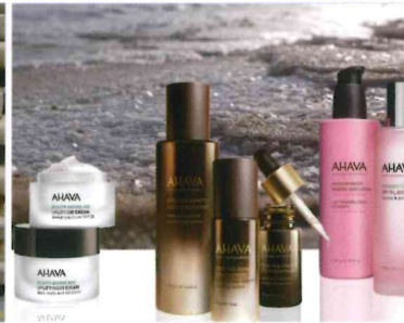
ENDVERPACKEN | LOGISTIK ab Seite 16