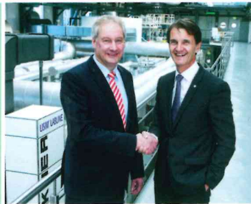
AUS DEN UNTERNEHMEN ab Seite 6

Schutzrechte Palettieren Packmittel | Packstoffe Faltschachteln | Veredelung Lebensmittel | Süßwaren Verschlüsse | Verschließsysteme