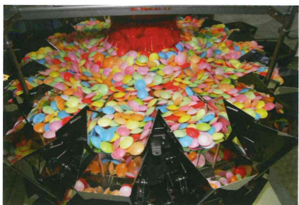
Mit einer Leistung von 100 bis 140 Takten pro Minute verwiegt die innovative Mehrkopfwaage ALPHA Advance z. B. bruchempfindliche und anhaftende Produkte.