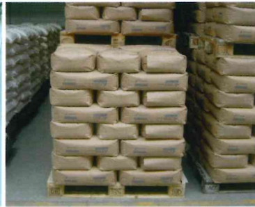
VERPACKUNGSPRÜFUNG ab Seite 10